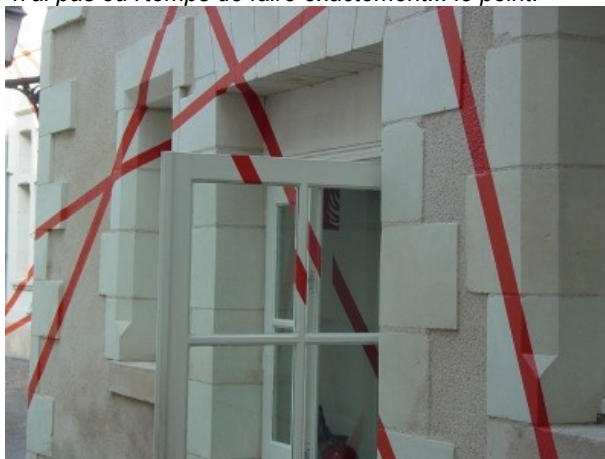
La poooooorte !!!