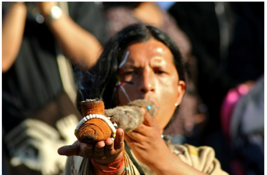
Le calumet. Rituels chamanes. de Netrace

contrairement aux idées reçues, non pas de faire la paix (d'où le nom « calumet de la paix ») mais de rentrer en contact avec les grands esprits. Il était tout de même utilisé lorsqu'il y avait des invités. Dans le calumet on introduisait un mélange aromatique de tabac et d'herbes.