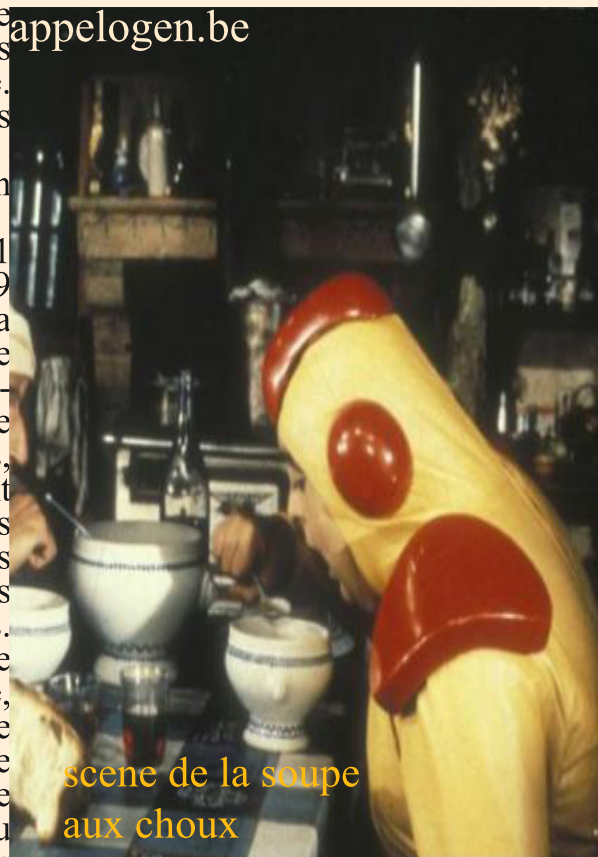
scene de la soupe aux choux