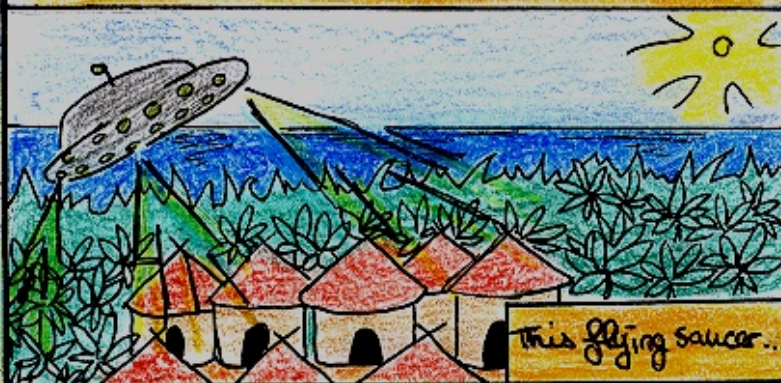
this flying saucer...

A long time ago - there about 60 years - a strange ufo landed our planet.