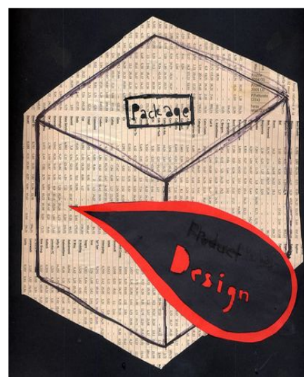
Youth With A Mission- International

Us : Were you interesting by Africa when you were very young? Was the opening on