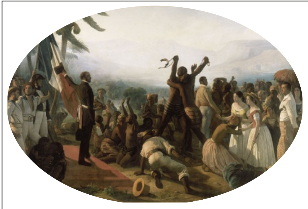
Auguste François Biard (1798-1882) L'abolition de l'esclavage dans les colonies françaises en 1848, huile sur toile.