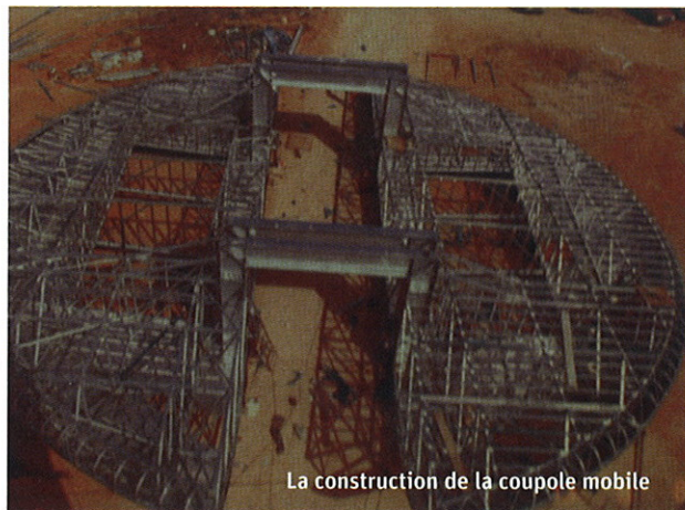
La construction de la coupole mobile

en construisant avec la Région et le Département, le gymnase de la Haute-Payre pour que les lycéens puissent pratiquer une activité sportive. Les installations sportives sont aujourd'hui propriété de la commune et gérées par elle.