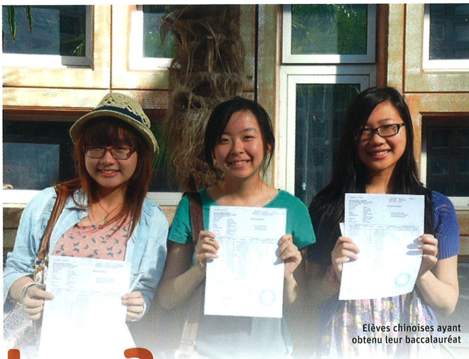
Elèves chinoises ayant obtenu leur baccalauréat