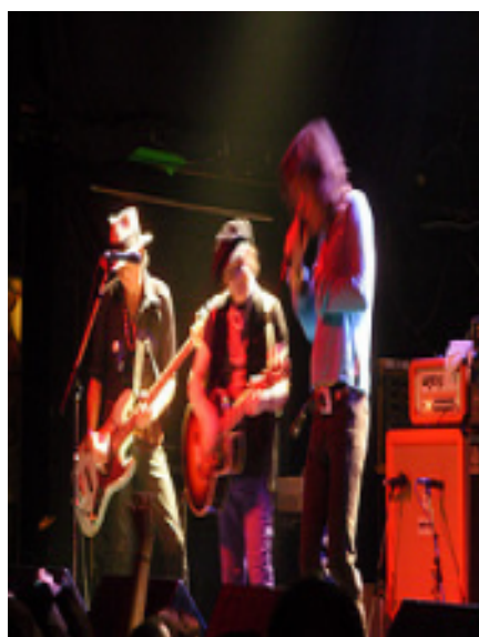
New York Dolls

Avec la fin du mouvement hippie, se développe le glam rock, mélange de rock à paillettes, de glamour et de décadence. Le glam rock, dans sa composante baroque, est personnifié par des compositeurs très différents qui vont des New York Dolls, groupe de travestis précurseurs du punk à David Bowie en passant par les