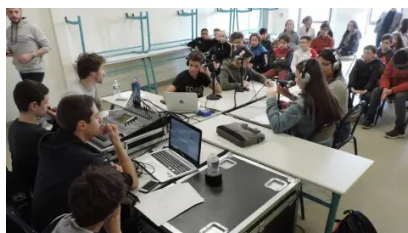
Une émission radio en direct du collège