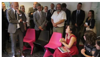
Blanquer l'Européen rend hommage aux Chinois à Jaunay-Marigny