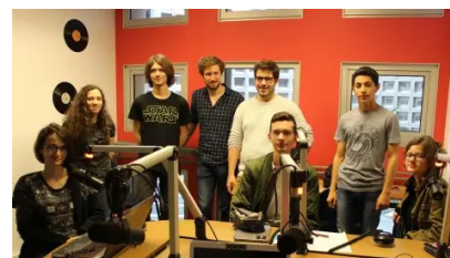
“ Développer l'aisance à l'oral ”